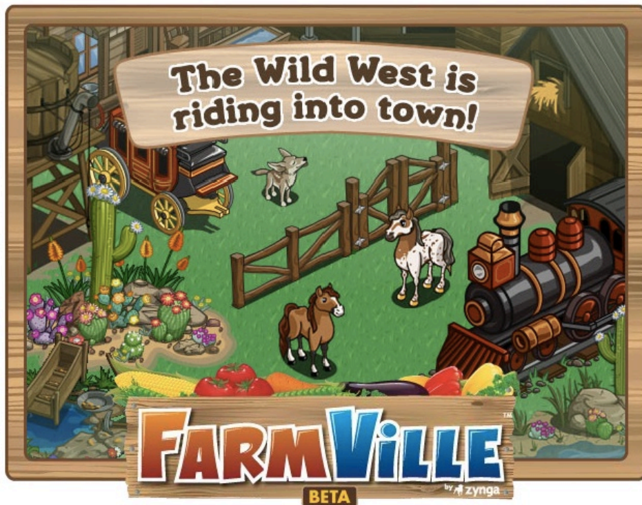
ภาพที่ 4 FarmVile

ในการปฏิสัมพันธ์ที่รวดเร็วทันใจผ่านการอัปเดตสถานะ นั้นคือถึงแม้ในช่วงเวลานั้นไม่มีเพื่อนที่ออนไลน์อยู่เลยแต่เจ้าของ FB ก็สามารถทำการ “ปฏิสัมพันธ์” ได้ทันทีตามที่ต้องการ ทำให้เกิดการเสพติด เช่นเดียวกับ SNSs อื่นๆ คือทำให้กิจกรรมใน SNSs กลายมาเป็นหนึ่งในนิสัยที่ต้องกระทำเป็นประจำทุกวัน (Thomsom, 2008)