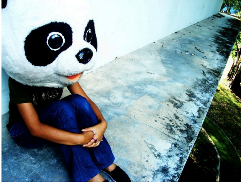
ภาพที่ 5 ภาพ profile ใน FB

หมายความว่าเจ้าของ FB ไม่ได้เชื่อว่า FB เป็นภาพสะท้อนลักษณะทางกายภาพจริงๆ แต่ในโลกของ FB นั้น พวกเขาสามารถ ตัดต่อ ปรับแต่ง เลือกสิ่งที่ดีที่สุดของพวกเขาเพื่อการนำเสนอ อาจจะเนื่องมาจากว่า FB ไม่ได้เป็นพื้นที่ของการถูกเห็นจากรอบด้านหรือไม่ได้เป็นความจริงของทั้งหมด แต่เป็นตัวตนของเจ้าของ FB ที่พวกเขาต้องการให้สังคมเห็น หรือ อาจเป็นตัวตนในอุดมคติของเจ้าของ FB นั้นๆ ที่ต้องการเปิดให้เพื่อนๆ และ เพื่อนของเพื่อนเห็น (ภาพที่ 5)