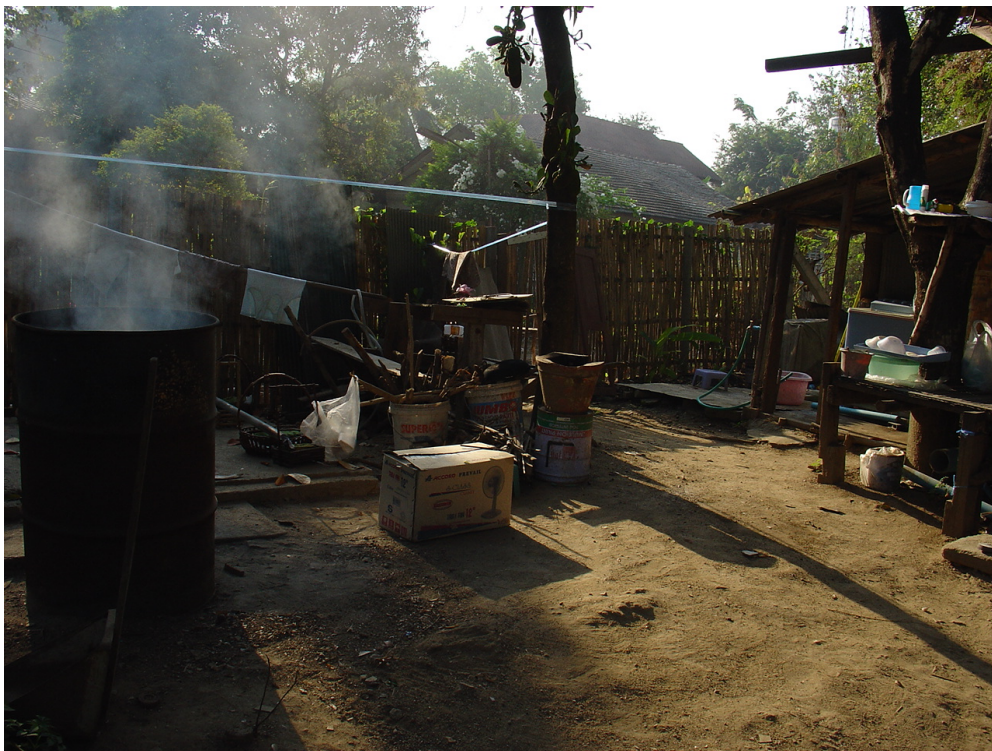
ภาพที่ 1 ช่วงเหียน (ปัตย์, 2551)

ช่วงเหียน (ภาพที่ 1) เป็นพื้นที่กิจกรรมทางสังคมในชุมชนหมู่บ้านเชียงใหม่ที่เกิดขึ้นจากกระยะว่างระหว่างเหียน (เรือน) ของแต่ละครอบครัว ที่ต่อเนื่องสอดแทรกไปทั้งชุมชนหมู่บ้านที่แต่ละกลุ่ม