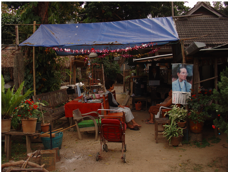
ภาพที่ 2 ช่วงเชื่อมที่มีความเป็นส่วนตัวและควบคุมปานกลาง (ปัตย์, 2551)

ผู้คนในช่วงเชื่อมเพื่อเป็น 1) พื้นที่กิจกรรมในชีวิตประจำวัน อาทิเช่น ดากผ้า, ซักผ้า, ทำอาหาร, นั่งเล่นพูดคุย, จัดงานศพ, วิ่งเล่น โดยในช่วงเชื่อมต่างๆ จะมีความหมายที่รู้จักกันเองภายในครอบครัวต่างๆว่าช่วงเชื่อมนี้มีใครเป็นผู้ครอบครองแต่ในที่นี้ไม่ได้หมายถึงการครอบครองในเชิงกรรมสิทธิ์ขาดตามกฎหมาย แต่หมายถึงการครอบครองในลักษณะที่ใช้งานมานาน ซึ่งการที่ช่วงเชื่อมต่างๆ ล้วนมีเจ้าของนี้จะส่งผลต่อกิจกรรมที่เกิดขึ้นในช่วงเชื่อมอย่างมากว่า ในช่วงเชื่อมนั้นๆ สามารถทำกิจกรรมได้บ้าง และยังส่งผลต่อสมาชิกของการรวมกลุ่มอีกด้วย เช่นช่วงเชื่อมที่มีผู้ครอบครองเป็นผู้อาวุโส จะทำให้ผู้อาวุโสคนอื่นๆ มารวมตัวกันที่ช่วงเชื่อมนั้นๆ ในขณะที่หากช่วงเชื่อมนั้นผู้ครอบครองเป็นวัยรุ่น เด็กรุ่น และวัยรุ่นคนอื่นๆ ก็จะมารวมตัวกัน ซ้อนทับกับ 2) พื้นที่สัญจรไปมาในชุมชนหมู่บ้าน โดยที่ทุกคนสามารถเดินผ่านไปมาในช่วงของเครือข่ายอื่นๆได้ทั้งหมู่บ้าน เมื่อผู้คนเดินผ่านกัน หรือเจอเพื่อนบ้าน จะมีการทักทาย นั่งเล่นพูดคุย ในบางครั้งเป็นระยะเวลาสั้น โดยเฉพาะอย่างยิ่งหากพบเจอผู้อาวุโสในกลุ่มเครือข่ายที่มีความสนิทสนม จะมีการเข้าไปกอดแสดงความสัมพันธ์ใกล้ชิด การซ้อนทับกันของพื้นที่สองลักษณะทำให้ช่วงเชื่อมเป็นพื้นที่ซึ่งมีการใช้งานตลอดเวลาในช่วงกลางวัน และเพิ่มโอกาสในการเกิดปฏิสัมพันธ์ระหว่างสมาชิกในชุมชนหมู่บ้านอีกทั้งเป็นกลไกในการป้องกันระวางภัยไม่ให้เกิดกิจกรรมไม่พึงประสงค์ขึ้น (ปัตย์และคณะ, 2550)