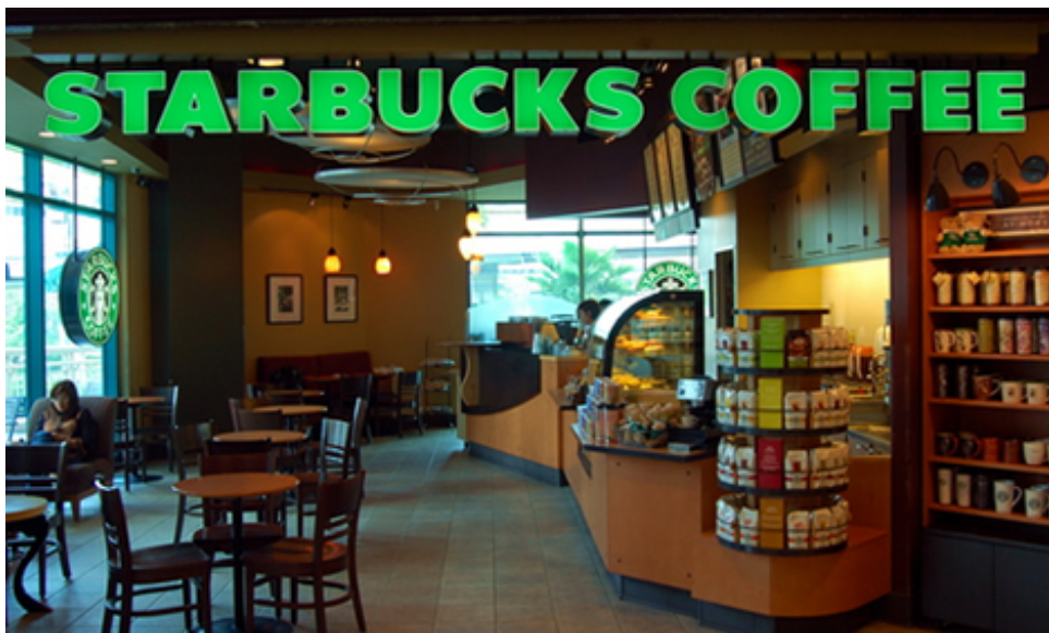
ภาพที่ 3 Starbucks สาขาเชียงใหม่ Airport plaza

ในขณะที่การใช้ร้านกาแฟเป็นพื้นที่ที่เกี่ยวข้องกับเทคโนโลยีในการทำงานและเชื่อมต่อเข้าสู่โลกของอินเทอร์เน็ตกำลังเป็นที่นิยมในเมืองไทย ในต่างประเทศการใช้ร้านกาแฟเป็นพื้นที่ที่เกี่ยวข้องกับเทคโนโลยีในการทำงานและเชื่อมต่อเข้าสู่โลกของอินเทอร์เน็ตได้กำลังถูกต่อต้านจากเจ้าของร้านกาแฟและนักดื่มกาแฟบางส่วนที่เริ่มมองว่ากิจกรรมเชิงเทคโนโลยีเหล่านี้ ได้เข้าไปรบกวนการกิจกรรมแก่นแท้ของร้านกาแฟซึ่งเป็นพื้นที่ปฏิสัมพันธ์ของผู้คน ดังเช่นที่ Allen (2009) ได้นำเสนอบทสัมภาษณ์เจ้าของร้าน Cafe Grumpy ร้านกาแฟแห่งหนึ่งใน New York ที่ได้ทำการห้ามการใช้คอมพิวเตอร์พกพา (Laptop) ที่ไม่บริการ การเชื่อมต่อ อินเทอร์เน็ต ไร้สายและปลั๊กไฟสำหรับเสียบคอมพิวเตอร์พกพาอีกต่อไป ไว้ว่า “... มันท้าเรา กาแฟเอสเปรสโซ่ชั้นนอร์สเยี่ยม แต่ว่าบรรยากาศมันเงียบมาก ผู้คนต่างสนใจแต่คอมพิวเตอร์ของตัวเอง ฉันคิดว่าร้านกาแฟมีไว้สำหรับพบปะ