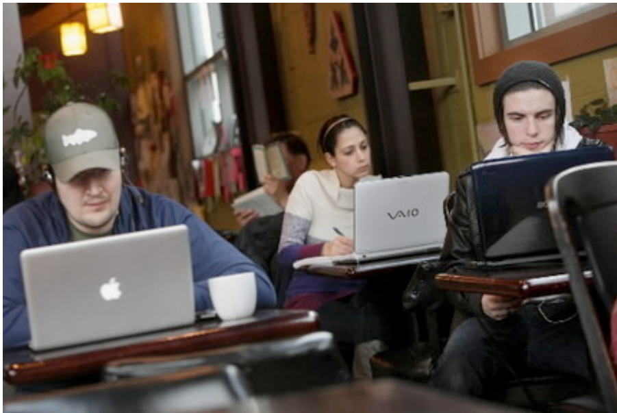
ภาพที่ 4 การใช้ร้านกาแฟเป็นพื้นที่ในการทำงานด้วยคอมพิวเตอร์พกพา ที่ได้รับความนิยมมากในอเมริกา (www.cleveland.com)

กัน ... เราเลยตัดสินใจว่าเราไม่สามารถอนุญาตให้มีการใช้คอมพิวเตอร์พกพา ถึงแม้ว่าคนนั้นๆ จะไม่ต่ออินเทอร์เน็ตก็ตาม ... มันคือประเด็นเรื่องของพื้นที่ที่คับแคบๆกับเรื่องของบรรยากาศ สาขาเซลซีของเราตอนนี้มีชีวิตชีวามากกว่าเดิม ผู้คนสามารถนั่งลง ดื่มเครื่องดื่มของเขา และพูดคุยสังสรรค์กับคนอื่นๆ ฉันทเคยเบื่อกับการที่ต้องคอยขอร้องให้ผู้คนแบ่งปันโต๊ะของพวกเขา และไม่ชอบที่ต้องคอยจ้องมองโลโก้ของแอปเปิ้ลตลอดเวลา ฉันรู้ว่า ผู้คนมากขึ้นเรื่อยๆ ที่ ‘ทำงานจากบ้าน’ และต้องการพื้นที่ที่นั่งสบายๆ และออนไลน์ (ภาพที่ 4) แต่เราต้องการให้ลูกค้าที่มาดื่มกาแฟเป็นผู้ที่มีความสำคัญอันดับแรก ... ” 2 บทสัมภาษณ์ของ Allen นั้นไม่ได้เป็นเพียงการแสดงไม่พอใจของเจ้าของร้านที่สูญเสียที่นั่งในการขายในร้านกาแฟของตนเองเท่านั้นแต่ยังแสดงถึงความรู้สึกไม่พอใจถึงผลกระทบจากเทคโนโลยีอินเทอร์เน็ตที่ได้เปลี่ยนแปลงความหมายของการใช้งานร้านกาแฟของผู้คนไป บทสัมภาษณ์นี้ได้ทำให้ผู้เชี่ยวชาญเกิดคำถามขึ้นว่า หากกิจกรรมในร้านกาแฟได้เกิดกิจกรรมใหม่ๆ จากผลกระทบของเทคโนโลยีอินเทอร์เน็ตไร้สายแล้ว กิจกรรมที่เกิดขึ้นใหม่นี้ได้เปลี่ยนแปลงนิยามและบทบาทของร้านกาแฟไปอย่างไร