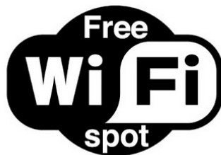
ภาพที่ 1 แสดงสัญลักษณ์ เชื่อมต่ออินเทอร์เน็ตไร้สายไม่เสียค่าใช้จ่าย ( http://2.bp.blogspot.com )

การบริการเชื่อมต่ออินเทอร์เน็ตไร้สายและร้านกาแฟในเขตเมืองนั้นแทบจะเป็นบริการขั้นพื้นฐานของร้านกาแฟปัจจุบัน สัญลักษณ์ “เชื่อมต่ออินเทอร์เน็ตไร้สายไม่เสียค่าใช้จ่าย (Free WiFi)” (ภาพที่ 1) หรือ “เชื่อมต่ออินเทอร์เน็ตไร้สายแบบมีค่าใช้จ่าย (WiFi)” ติดแสดงอยู่หน้าทางเข้าร้านกาแฟแทบทุกร้านในเมือง ซึ่งทำให้ผู้เข้าไปดื่มกาแฟสามารถใช้อุปกรณ์อิเล็กทรอนิกส์ไร้สายต่างๆ ซึ่งเป็นส่วนหนึ่งของอุปกรณ์ในชีวิตประจำวันของคนเมืองต่อเชื่อมกับอินเทอร์เน็ตได้ทันที รวมไปถึงการแบ่งพื้นที่ส่วนหนึ่งของร้านกาแฟให้เป็นพื้นที่ของการใช้คอมพิวเตอร์ที่สามารถใช้อินเทอร์เน็ตได้ทันที (ภาพที่ 2)