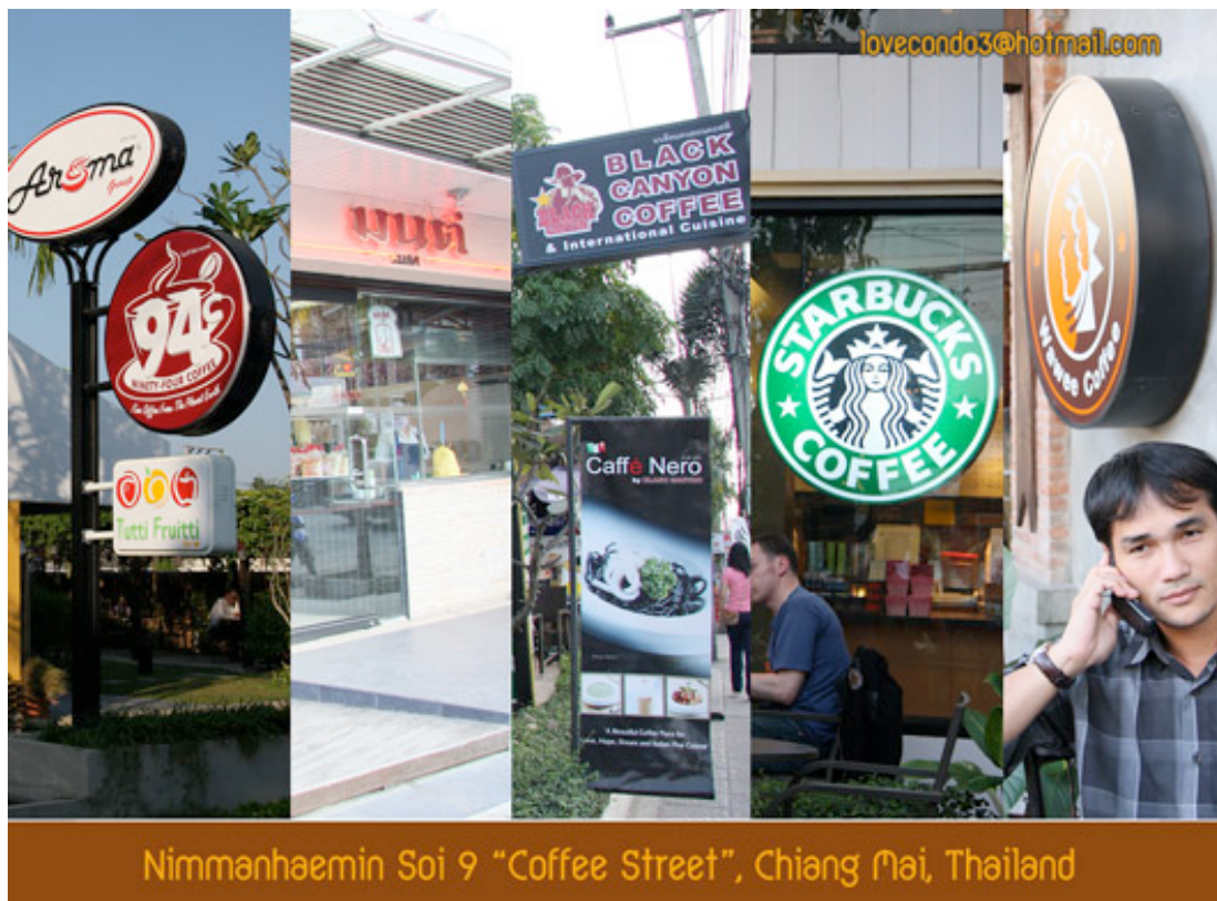
ภาพที่ 6 ร้านกาแฟในย่านนิมมานเหมินท์ เชียงใหม่

พบปะสังสรรค์ ร้านกาแฟได้กลายมาเป็นพื้นที่ในชีวิตประจำวันของคนเมืองเชียงใหม่ ที่มีการใช้งานร้านกาแฟไม่แตกต่างจากร้านกาแฟสมัยใหม่ทั่วโลกนั้นคือเป็นพื้นที่ซึ่งซ้อนทับระหว่างพื้นที่ทางสังคมเสมือนและพื้นที่ทางสังคมกายภาพ โดย Lovecondo3 นักท่องเที่ยวคนหนึ่งเมื่อมาท่องเที่ยวในถนนนิมมานเหมินท์ได้ทำการบรรยายบรรยายภาค ถนนนิมมานเหมินท์ว่าเป็นถนนสายกาแฟ 12 ดังนี้ “เมื่อถามถึงถนนนิมมานเหมินท์ จังหวัดเชียงใหม่ ทุกคนคงรู้จักว่าเป็นถนนแฟชั่น ถนนไฮโซ ถนนฮิป ฮิป ของคนรุ่นใหม่ ถนนร้านเสื้อผ้าวัยรุ่น ถนนร้านค้าทันสมัย ก็ฟลอปดั่งๆ ร้านค้าของตกแต่งบ้านมีดีไซน์ ถนนร้านผับชื่อดัง และถ้าคุณเดินไปถึงถนนนิมมานเหมินท์ ซอย 9 คุณคงแปลกใจ เพราะตั้งแต่ปากซอย ซ้ำซอยของซอยนี้โดยรอบจะเต็มไปด้วยร้านกาแฟชื่อดังทั้งตั้งในท้องถิ่น ตั้งในประเทศ และต่างประเทศที่ผุดขึ้นมาเป็นดอกเห็ด ไม่ว่าจะเป็นร้านกาแฟ วาวิ ร้าน 94 คอฟฟี่ ร้านกาแฟสตาร์บัคส์ ด้านหน้าซอย ร้านแบล็คแคนยอน ร้านกาแฟต้นมสต ร้านโตและสต เลย์ไปหน่อยจะมีร้านกาแฟดอยช้าง และร้านอื่นๆ ที่ผมจำชื่อไม่ได้ อีกสองสามร้าน”