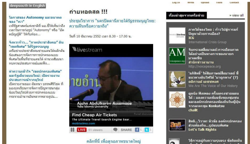
ภาพประกอบ 2: เสียง 'คนใน' “ร้อยคนร้อยคลิป: การเมืองการปกครองชายแดนใต้ที่ควรจะเป็น”

การถ่ายทอดสดออนไลน์ เวทีสัมมนา “นครปัตตานีภายใต้รัฐธรรมนูญไทย: ความฝันหรือความจริง?”